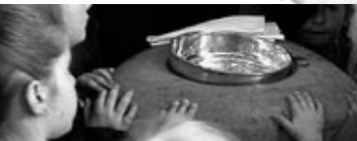
Am Taufstein in Lüerdissen

Was einen Menschen zum Gliedmaß des Körpers Jesu Christi macht, ist die Taufe. Das unterscheidet auch unsere christliche Gemeinschaft von anderen Interessenge-