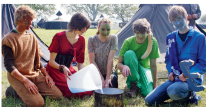
Aufgabe der Lager-Olympiade: Fünf Teilnehmer brauen Seelenwasser, um ein nordische Gottheit zu befreien.