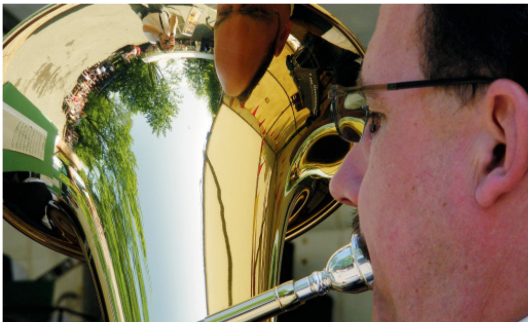
Heitere Aussichten: Auch in den Instrumenten spiegelt sich die schöne Pfingststimmung an der Hasenbreite wider.

cher tummelten sich im dichten Gewirr bei Bier und Wasser, Suppe und Bratwurst auf dem mit Biertischen bestückten Festplatz, lauschten den flotten Stücken des Blasorchesters oder nutzten den Sommerplatz zum gemütlichen Pfingstplausch unter Schützen.